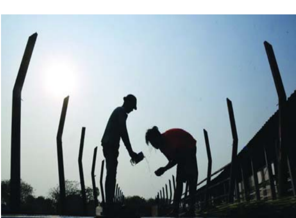
తీసుకొని ఎప్పటికప్పుడు కనీస వేతనాన్ని నిర్ణయిస్తామని కేంద్ర ప్రభుత్వం కొత్త వేతన నిబంధనలు చెబుతున్నాయి.

కార్మిక, ఉద్యోగ వర్గాలకు శుభవార్త. వారానికి 48 గంటల పని పరిమితి, తప్పనిసరిగా వారానికొక విశ్రాంతి దినం, ఓవర్ టైమ్ పనికి అదనపు చెల్లింపుపై కేంద్ర ప్రభుత్వం గెజిట్ నోటిఫికేషన్లు జారీచేసింది. దీంతో గతంలో నాలుగు కార్మిక కోడ్లలో చేసిన ఈ ప్రతిపాదనలు అధికారిక హోదాను పొందాయి. దేశవ్యాప్తంగా కంపెనీలు వీటిని ఇక కచ్చితంగా పాటించాల్సింది. వ్యాపానికీ నాలుగు కార్మిక కోడ్లు 2025 నవంబరు 21 నుంచే అమలులోకి వచ్చాయి. అయితే మే 8, 9 తేదీల్లో వాటికి సంబంధించిన తుది నిబంధనలు, నియమాలతో కేంద్ర ప్రభుత్వం దాదాపు 30 అధికారిక గెజిట్లను ప్రచురించింది. దీంతో ఈ కార్మిక సంస్కరణ ప్రక్రియ పూర్తయింది.