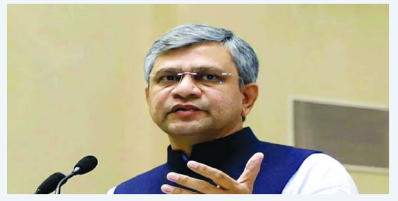
పశ్చిమాసియా ఉద్ధిక్తతల వల్ల ఎదురవుతున్న సవాళ్లను అధిగమించడానికి దేశ పౌరులకు ప్రధాని నరేంద్ర మోదీ చేసిన విజ్ఞప్తులకు మద్దతుగా కేంద్రమంత్రి అశ్వినీ వైష్ణవ్ కీలక వ్యాఖ్యలు చేశారు.

పశ్చిమాసియా ఉద్ధిక్తతల వల్ల ఎదురవుతున్న సవాళ్లను అధిగమించడానికి దేశ పౌరులకు ప్రధాని నరేంద్ర మోదీ చేసిన విజ్ఞప్తులకు మద్దతుగా కేంద్రమంత్రి అశ్వినీ వైష్ణవ్ కీలక వ్యాఖ్యలు చేశారు. ఇలాంటి సమయంలో దేశ ప్రజలు, వ్యాపార సంస్థలు విదేశీ మారక ద్రవ్య వినియోగాన్ని తగ్గించాలని పిలుపునిచ్చారు. అదే సమయంలో దేశానికి మరింత విదేశీ మారక ద్రవ్యాన్ని సంపాదించే దిశగా కృషి చేయాలని సూచించారు. దిల్లీలో జరిగిన సీఐఐ వార్షిక బిజినెస్ సమ్మిట్-2026లో ప్రసంగిస్తూ ఈ మేరకు వ్యాఖ్యలు చేశారు. ‘యుద్ధం ఇంకా కొనసాగుతోంది. ఆదివారం జరిగిన పరిణామాలను చూస్తే కూడా కాల్పుల విరమణ ఇప్పటికీ చాలా దూరంలో ఉందని మనందరికీ అర్థమవుతోంది. మన ప్రధానమంత్రి మనందరినీ తీసుకుంటూ పౌరులగా మనం విదేశీ మారకద్రవ్యం అవసరమయ్యే అన్ని విషయాలపై మన ఖర్చును తగ్గించుకోవచ్చు. పౌరులుగా మన జీవితాల్లో విదేశీ మారక ద్రవ్య వినియోగాన్ని తగ్గించేందుకు ఏం చేయగలమో గుర్తించాలి. విదేశీ మారకాన్ని ఆదా చేయడం చాలా ముఖ్యం’ అని అశ్వినీ వైష్ణవ్ తెలిపారు.