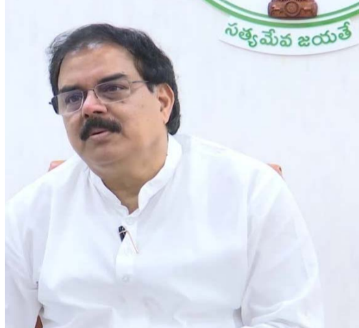
అమరావతి రాష్ట్రంలో ఎల్పీజీ గ్యాస్ సరఫరాలో నెలకొన్న బ్యాక్ లాగ్ ను ఈ నెల 16వ తేదీ నాటికి పూర్తిస్థాయిలో పరిష్కరించాలని రాష్ట్ర ఆహార, పౌర సరఫరాల శాఖ మంత్రి నాదెండ్ల మనోహర్ అధికారులను ఆదేశించారు. విజయవాడ నుంచి జిల్లాల పౌర సరఫరాల అధికారులతో టెలికాన్ఫరెన్స్ నిర్వహించారు. గ్యాస్ సరఫరా, పీడీఎస్ బియ్యం అక్రమ రవాణా నిరోధం, పెట్రోల్ బంకుల పర్యవేక్షణ వంటి కీలక అంశాలపై దిశానిర్దేశం చేశారు. కొన్ని జిల్లాల్లో గ్యాస్ బుకింగ్ చేసినా డెలివరీలో తీవ్ర జాప్యం జరుగుతోందని, ముఖ్యంగా పశ్చిమ గోదావరి, ఏలూరు, అనకాపల్లి, విశాఖ వట్సుం, గుంటూరు జిల్లాల్లో బ్యాక్ లాగ్ - మగతా3లో