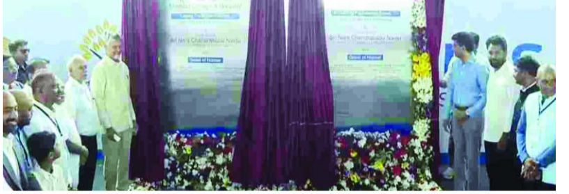
అమరావతి కావాలన్న త్వరగా ఇస్తామని వెల్లడించారు. రాజధాని అమరావతిలో త్వరలోనే 500 పడ మంగళగిరి మండలం నిదమర్రులో కిమ్స్ కల నూవర్ స్పెషాలిటీ ఆస్పత్రి అందుబాటులోకి రాబోతుందని సీఎం చంద్రబాబు టులోకి రాబోతుందని సీఎం చంద్రబాబు భూమిపూజ చేశారు. అనంతరం బైసర్ స్కీల్ తెలిపారు. దీనికి ఎలాంటి అనుమతులు వర్కిటీ నిర్మాణానికి - మగతా3లో

నిదమర్రు వద్ద కిమ్స్ ఆస్పత్రికి భూమిపూజ, బైసర్ స్కీల్ వర్కిటీ నిర్మాణానికి శంకుస్థాపన చేసిన సీఎం చంద్రబాబు 2027 మే 13న కిమ్స్ ఆస్పత్రిని ప్రారంభిస్తామని వెల్లడి