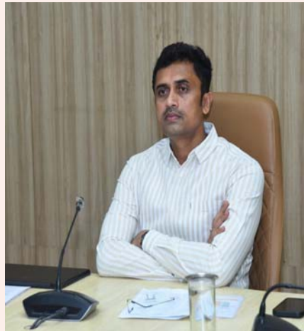
పుట్టపర్తి, మే 9 సీమ వార్త