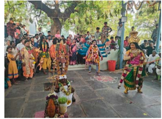
ఆకట్టుకున్న దుర్గమ్మ వేషధారణలు

గ్రామోత్సవం ముందు యువతులు సూనె దీపాలతో అమ్మవారి ఎదుట ప్రత్యేక ఆకర్షణగా నిలిచారు. రథోత్సవం ముందు దప్పులు వాయిద్యాలు, పెద్ద ఎత్తున బాణాసంచా పేల్చారు. అడుగుడుగునా అమ్మవారికి మొక్కులు తీర్చుకునేందుకు మహిళలు, యువతులు పెద్ద ఎత్తున వీధుల్లోకి తరలివచ్చారు. అమ్మవారి వార్షిక