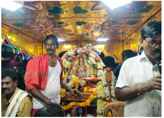
భక్తులకు దర్శనమిస్తున్న అమ్మవారు

గంగాభవాని 18వ వార్షికోత్సవం లో భాగంగా శనివారం సాయంత్రం గాండ్లపెంట గంగాభవాని అమ్మవారి ఊరేగింపు కార్యక్రమం అట్టహాసంగా సాగింది. సందర్శకులకు చెందిన కళాకారులు చేపట్టిన దుర్గమ్మ విన్యాసాలు, పీలేరుకు చెందిన పిల్లల గ్రోవి కోలాటం, కీలుగురాళ్ల వేషధారణలు, కళాకారులు చేపట్టిన చెక్కబణసలు తదితర సాంస్కృతిక కార్యక్రమాల నడుమ అమ్మవారు మండల కేంద్రంలో పురపీఠపు గుండా భక్తులకు దర్శనమిచ్చారు. ముఖ్యంగా బెజవాడ కనకదుర్గమ్మ విన్యాసాలు, పలు దేవతలకు చెందిన కీర్తనలకు కళాకారులు చేపట్టిన నృత్య ప్రదర్శన సభికులను ఎంతగానో ఆకట్టుకున్నాయి. దారి పొడుపునా మహిళలు అమ్మవారికి కామి కర్పూరం సమర్పించి మొక్కులు తీర్చుకున్నారు. ఈ సందర్భంగా అమ్మవారి