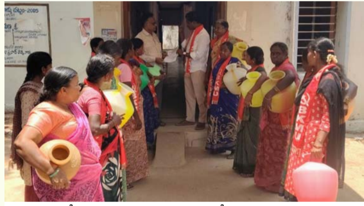
ఓ.బుజీదేవరచెరువు: వినతి పత్రం అందజేస్తున్న సిపిఐ నాయకులు