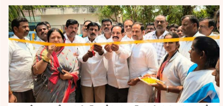
మల్ల మీద పల్లిలో ఆయుష్మాన్ ఆరోగ్య మందిర్ ను ప్రారంభిస్తున్న ఎమ్మెల్యే.