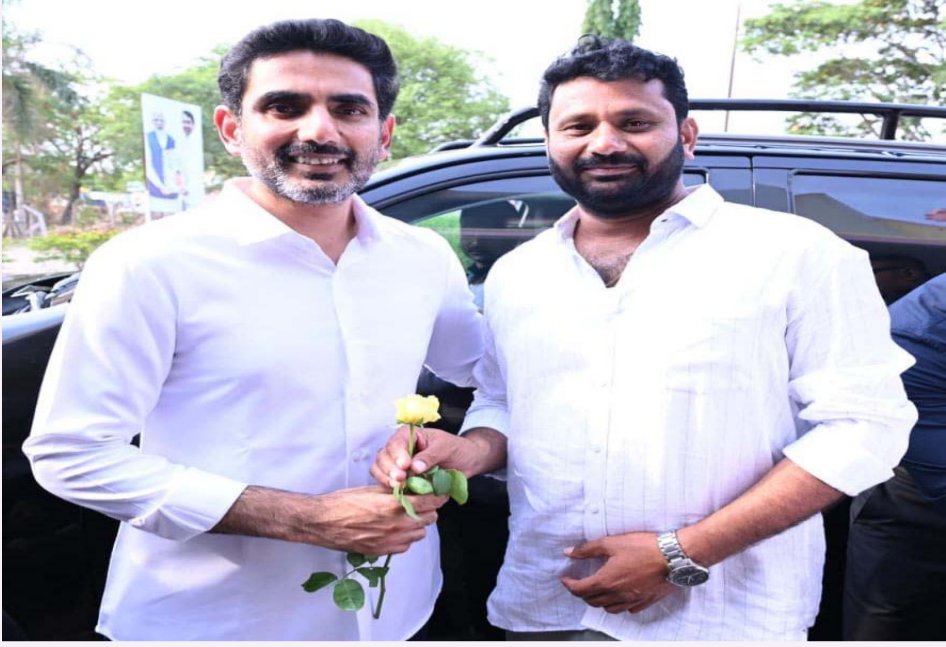
గోరంట్ల మీ 15 సీమ వార్త.

నారా లోకేష్ తో... లోకేష్ యువ దలం అభినేత "పచ్చ" భేటీ.