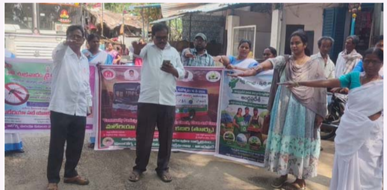
నంబలపాలకం: మే 16 (సమీప వార్త):