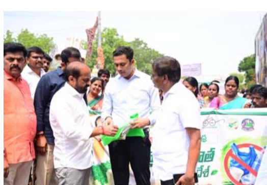
చర్యలు కూడా తీసుకొచ్చే దిశగా ప్రభుత్వం ఆలోచిస్తోందన్నారు. అయితే చట్టాల కంటే ముందుగా ప్రజల్లో స్వచ్ఛంద మార్పు రావాలని, ముఖ్యంగా వ్యాపారులు, హోటళ్లు, స్ట్రీట్ వెండర్లు ప్లాస్టిక్ వినియోగాన్ని పూర్తిగా నిలిపివేయాలని సూచించారు. మీడియా ప్రతినిధులు కూడా ప్రజల్లో నిరంతరం అవగాహన కల్పిస్తూ పరిశుభ్రమైన సమాజ నిర్మాణంలో భాగస్వాములు కావాలని కోరారు. పరిశుభ్రమైన సమాజం ద్వారానే ఆరోగ్యవంతమైన జీవితం సాధ్యం. స్వచ్ఛాంధ్రప్రదేశ్ నిర్మాణంలో భాగంగా ధర్మవరం ప్లాస్టిక్ రహిత నిర్మాణకార్యక్రమం తీర్చిదిద్దడం అని మంత్రి సత్యకుమార్ యాదవ్ ప్రజలకు విలువునిచ్చారు.