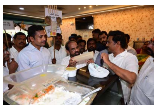
స్వచ్ఛ ఆంధ్ర -- ప్లాస్టిక్ రహిత రాష్ట్రం అవగాహన కార్యక్రమంలో పాల్గొన్న మంత్రి సత్యకుమార్ యాదవ్