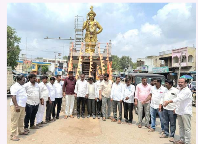
హిందూపురం మే 19 సీమ వార్త.