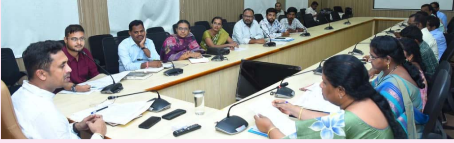
పుట్టపర్తి,మే20 (సీమవార్త బ్యూరో) :-