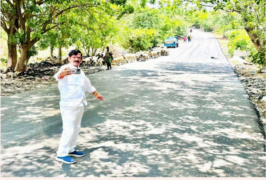
పుట్టపర్తి మే 22 సీమ వార్డు.