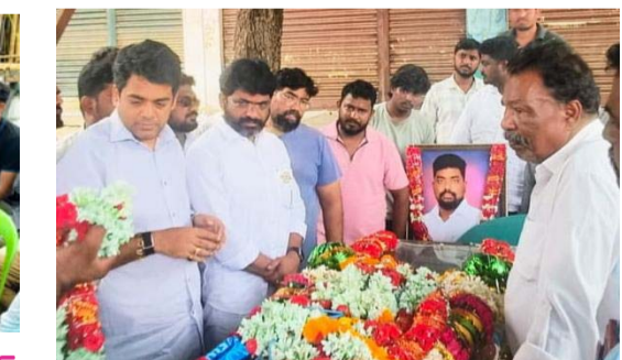
...తాడిపత్రి జనసేన పార్టీకి తీరని లోటు.